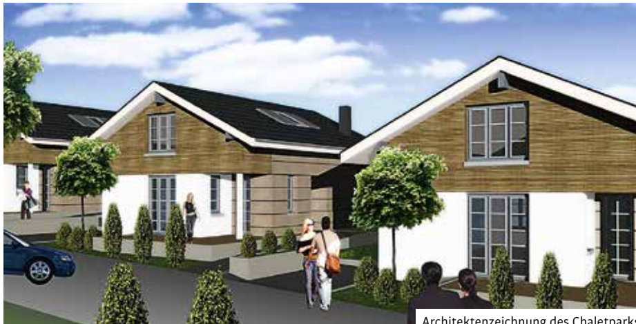
Architektenzeichnung des Chaletparks

Weiterhin wurden sowohl das Restaurant „Seaside“ und die beiden Gasträume als auch 25 Zimmer und 12 Bäder erneuert bzw. renoviert.