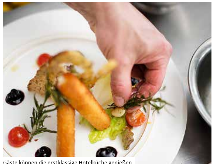
Gäste können die erstklassige Hotelküche genießen