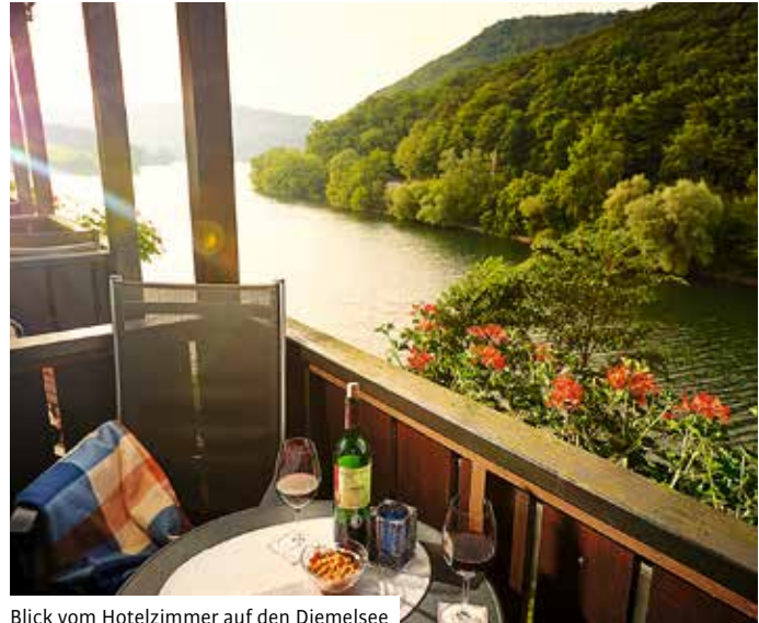
Blick vom Hotelzimmer auf den Diemelsee

handelt werden“, urteilt Gert Göbel. Denn die Erfahrungen zeigen: „Wo die Qualität stimmt, läuft es“. So wurde auch in 2015 wieder kräftig investiert.