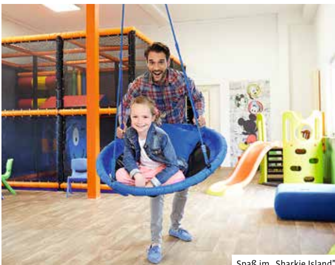
Spaß im „Sharkie Island“

Auf jeden Fall ist die Gefahr groß, dass die Kinder und natürlich auch die Älteren zu Wiederholungstätern werden und immer wieder kommen.