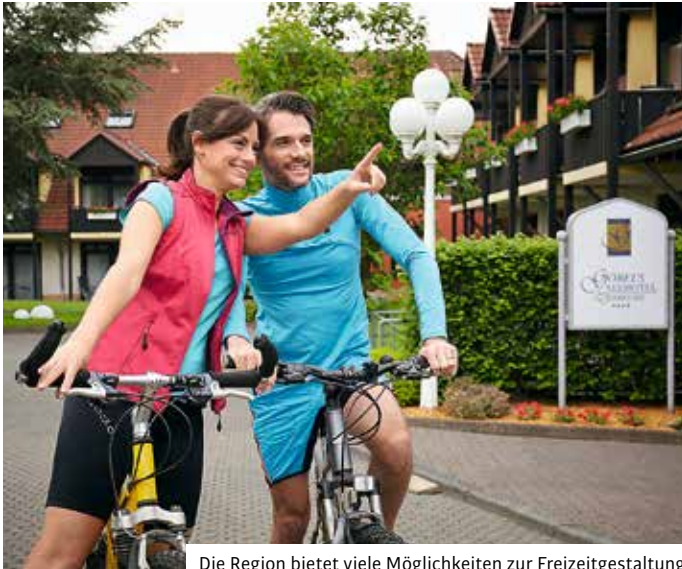
Die Region bietet viele Möglichkeiten zur Freizeitgestaltung