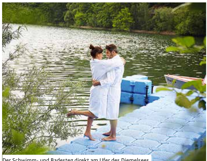
Der Schwimm- und Badesteg direkt am Ufer des Diemelsees