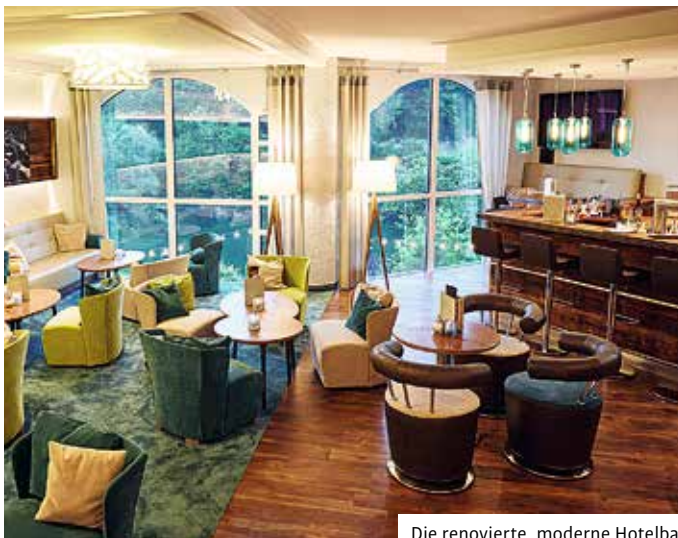
Die renovierte, moderne Hotelbar